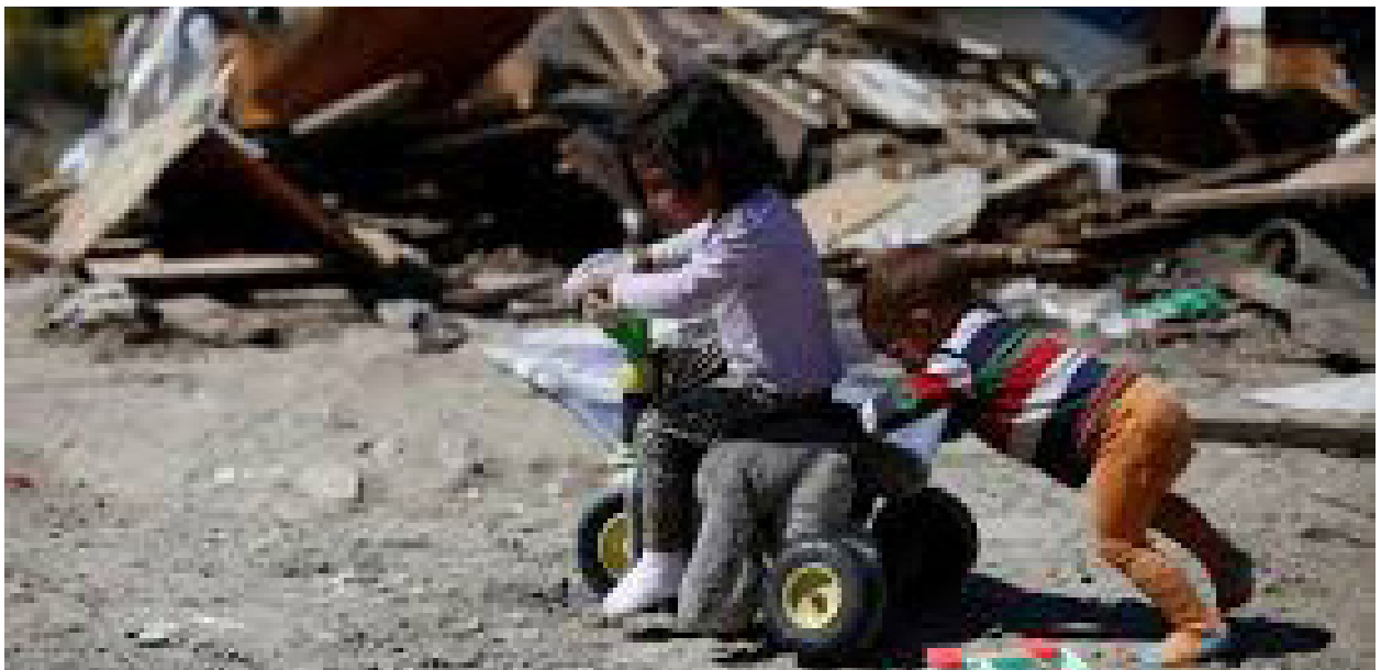
Niños con dificultades