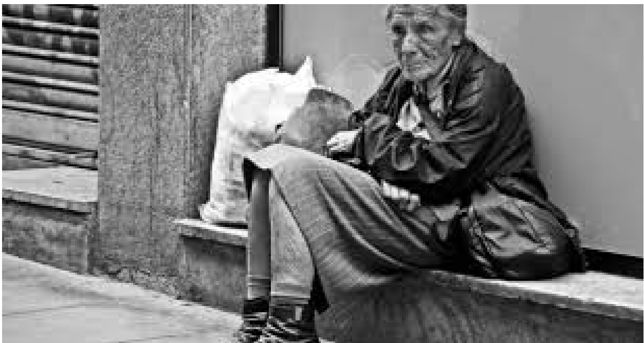
Personas sin hogar

Se muestran las siguientes imágenes de personas que en nuestra sociedad necesitan de la ayuda de los demás.