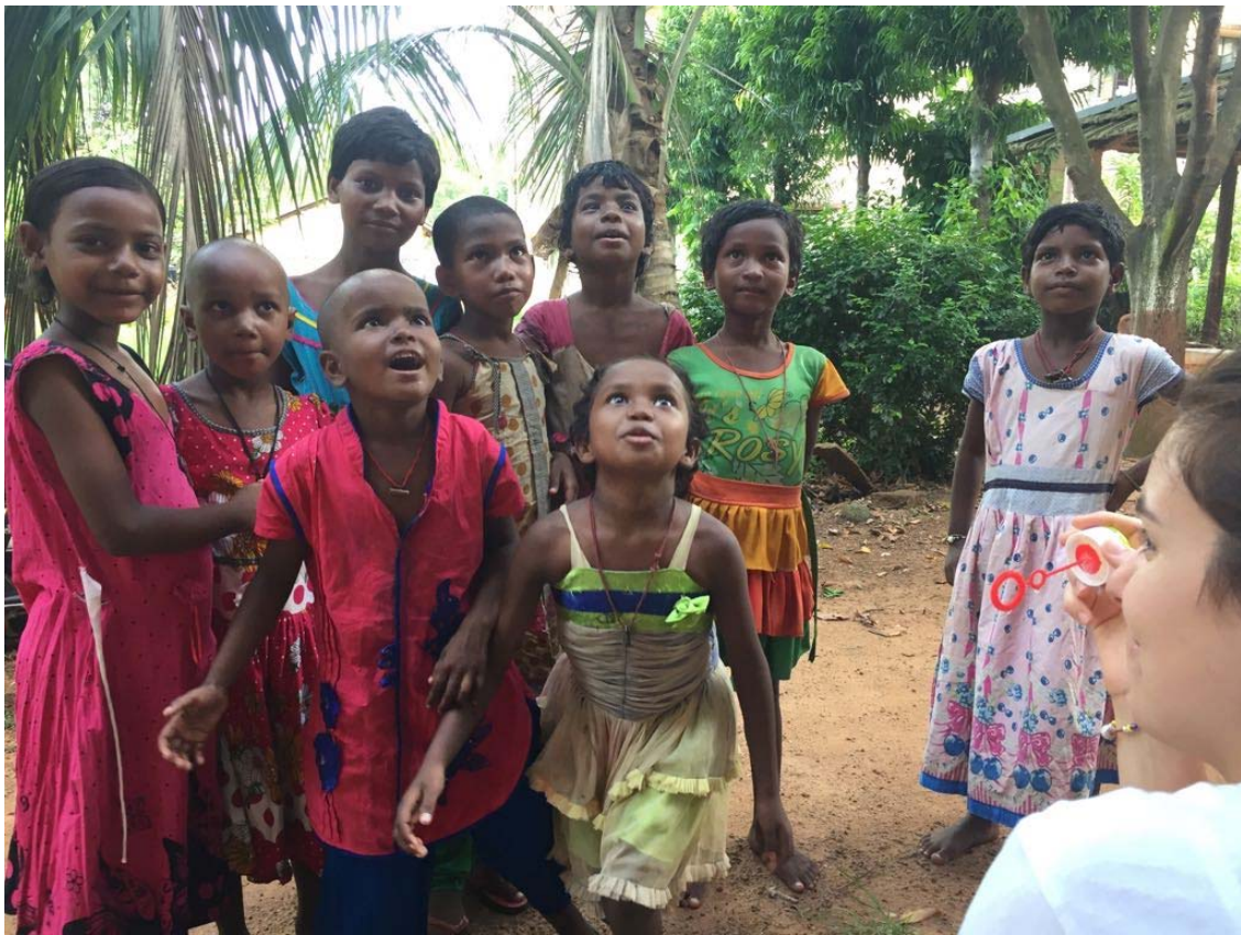
Niñas y niños de Talit (India) disfrutando de un juego.